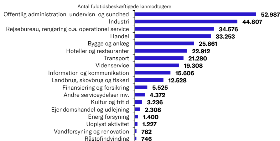
Figur 1: Internationale kolleger fordelt på brancher, marts 2023